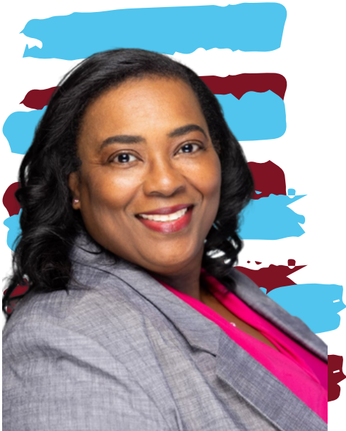
Toshiba Rice (titular)

Wake Early College of Health and Science